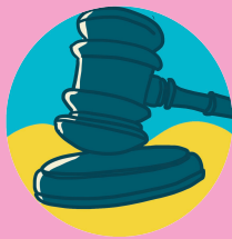
Juzgados de familia