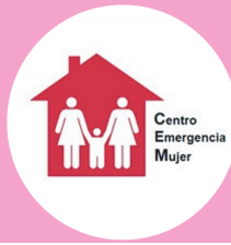
Centro de Emergencia Mujer (se encuentra en las comisarías principales de los distritos de Lima)

*Exige que la PNP o Fiscalía llene tu Ficha de Valoración de Riesgo para que puedas acceder a medidas